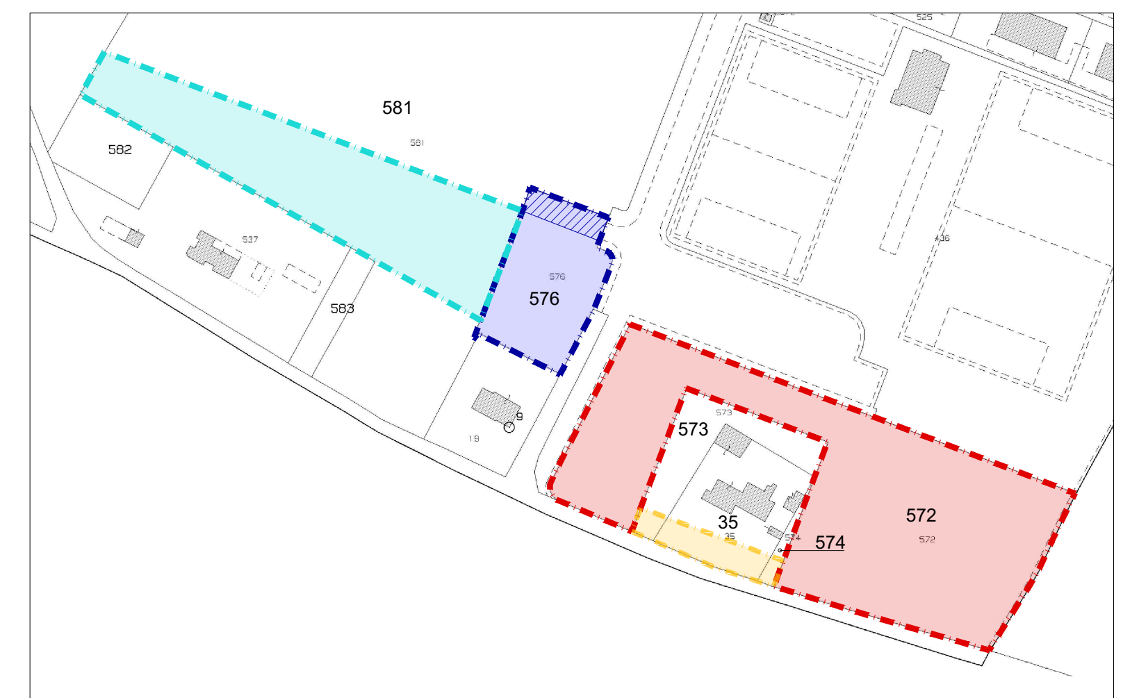
ESTRATTO DI MAPPA CATASTALE N.C.T.R.

Sempre con il medesimo atto è stata costituita una servitù di passaggio pedonale e carroia mediante ogni sorta di veicoli, a carico della particella 576 al fine di permettere l'accesso diretto da Viale dello Sport al compendio identificato con la particella 575 di proprietà della Soc. B.B.F. Costruzioni S.A.S..