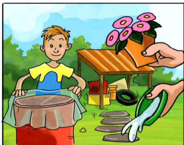
METTI AL RIPARO DALLA PIOGGIA TUTTO CIÒ CHE PUÒ RACCOGLIERE ACQUA.

(*) Leggi attentamente le istruzioni riportate sulle confezioni.