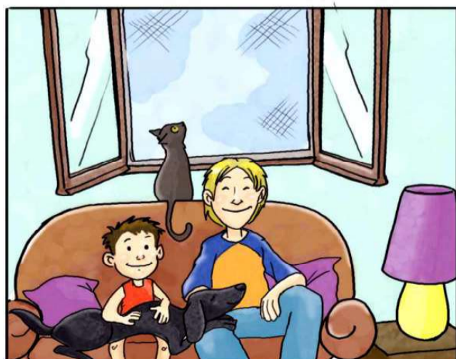
IN CASA USA LE ZANZARIERE ANZICHÉ ZAMPIRONI E FORNELLETTI.