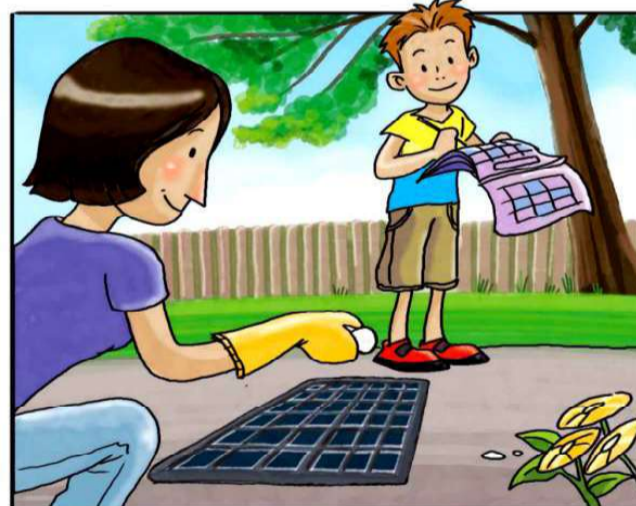
RICORDATI DI TRATTARE I TOMBINI CON PASTIGLIE DI INSETTICIDA, NEL PERIODO DA APRILE A SETTEMBRE. (*)