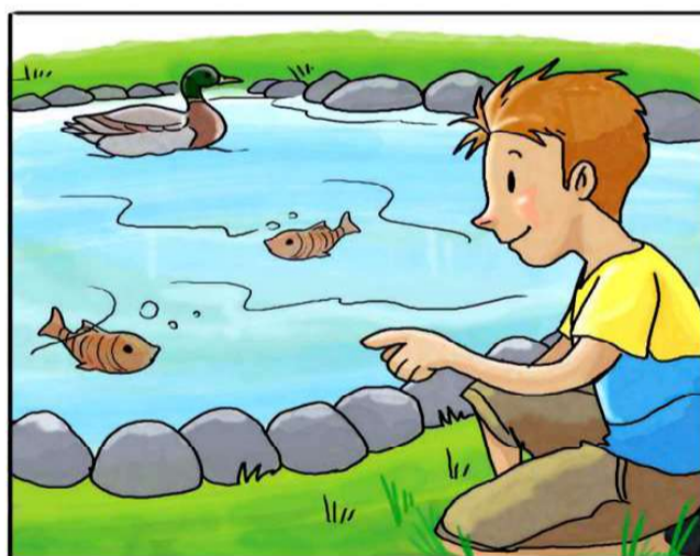
INTRODUCI I PESCI IN VASCHE E FONTANE.