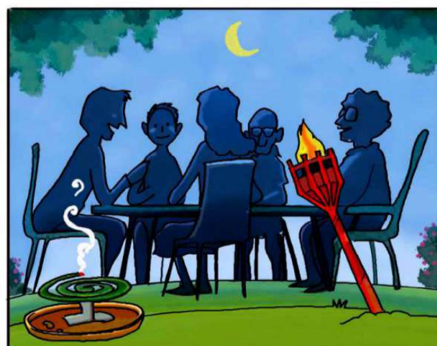
QUANDO SOGGIORNI ALL'APERTO, PROTEGGITI CON REPELLENTI AMBIENTALI. (*)

(*) Leggi attentamente le istruzioni riportate sulle confezioni.